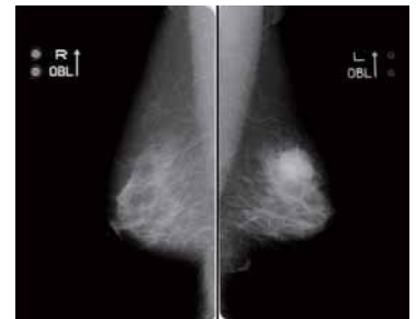
マンモグラフィ画像