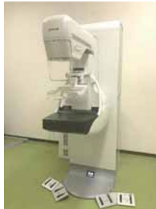
当院のデジタルマンモグラフィ装置

マンモグラフィは、乳がん の初期症状の1つでもある 石灰化や腫瘍などを発見 する事が出来ます。